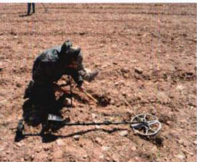
Intervención autorizada en el yacimiento arqueológico del Cabezo de Alcalá de Azaila, Teruel (Fotografía de F. Romeo extraída del artículo: "La tecnología de los detectores de metal principios de funcionamiento y análisis de los escenarios de expolio arqueológico").

En caso de que sea un objeto pequeño y corra grave peligro de desaparición o deterioro, recógelo con cuidado y mételo en una bolsa. No lo limpies , es más, si lo mantienes con parte de la tierra en la que se encuentra mejor. No olvides anotar la ubicación del lugar donde lo has hallado. Llama cuanto antes al BIBAT, Museo de Arqueología de Álava y concierta una cita para entregarlo.