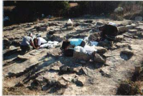
Intervención arqueológica en el templo de Nuestra Señora de Larrara, Alegría-Dulantzi.